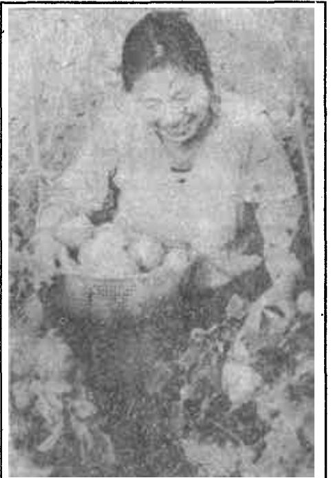
利津县集贤乡把发展大棚蔬菜列为发展高产优质高效农业, 实现小康计划的拳头工程。目前全乡已发展冬暖式蔬菜大棚406栋, 一冬春可增加经济收入320万元。

原先被人们瞧不上眼的棉籽壳, 却成了东营区牛庄镇大杜村群众发家致富的宝贝疙瘩。一年来, 这个村近80户人家依靠棉籽壳作培养基种植蘑菇, 已收入8万多元。